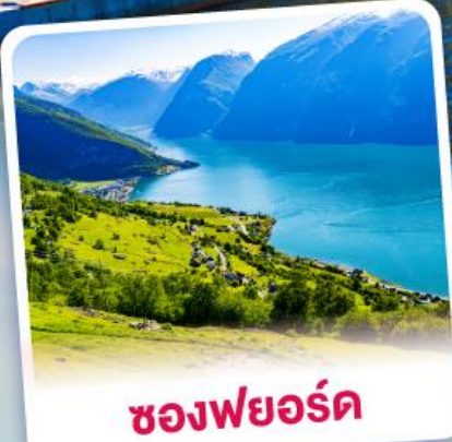
ช่องฟยอร์ด