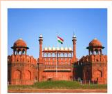
♥♦♦ Agra Fort