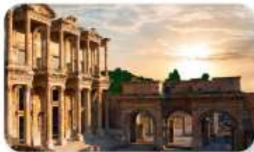
เมืองโบราณเอฟเฟซุส