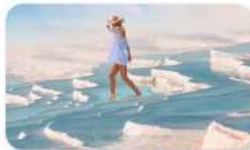
ปราสาทปูยฝาย