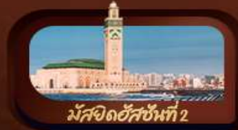
มัสยิดอัลฮักซันที่ 2