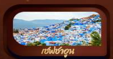
เชฟชาฮูน