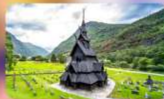
Unseen โบสถ์ Borgund Stave Church