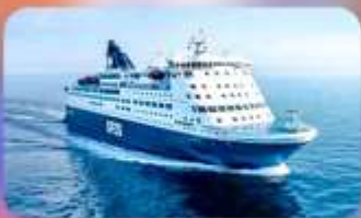
พิกบนเรือสำราญ แบบ Window Room 1 คืน

Quality Hotel Hasle Linie หรือเทียบเท่า Scandic Voss หรือเทียบเท่า Grand Hotel Terminus หรือเทียบเท่า Dr. Holms Hotel หรือเทียบเท่า Go Nordic Cruiseline หรือเทียบเท่า Scandic Sydhavnen หรือเทียบเท่า