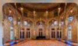
Palacio the Bolsa