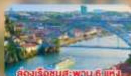
ล่องเรือชมสะพาน 6 แห่ง ในคูร์เมืองปอร์โต