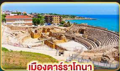
เมืองตารราโกนา