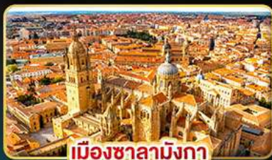
เมืองซาลามังกา