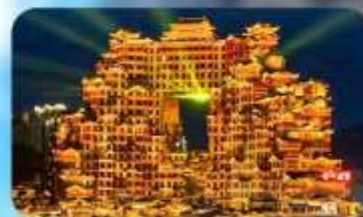
ตึก 72 ชั้น