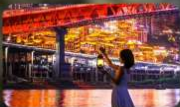
สวนริมแม่น้ำแกรนด์เธียร์เตอร์