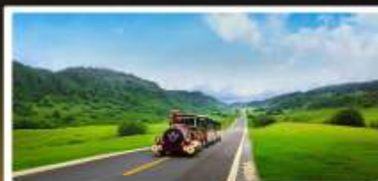
เขานางฟ้า