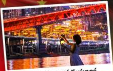
สวนริมน้ำแกรนด์เธียร์เตอร์