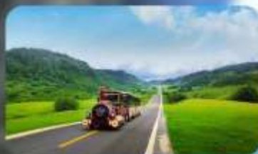
เจานางฟ้า