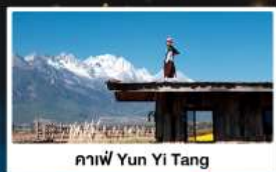
คาเฟ่ Yun Yi Tang