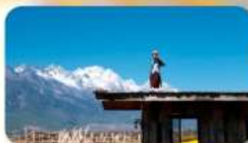
กาแฟ Yun Yi Tang