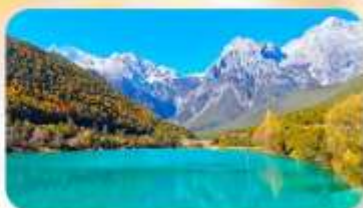
ทะเลสาบไป๋สุยเหอ