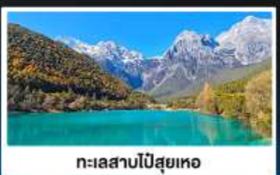
ทะเลสาบไป๋สยู่เหอ