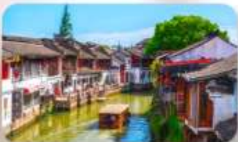
เมืองโบราณจูเจียวเจียว