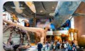
พิพิธภัณฑ์เซี่ยงไฮ้