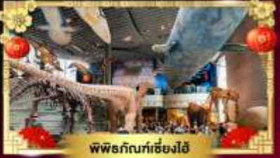
พิพิธภัณฑ์เซี่ยงไฮ้