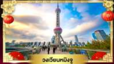
วงเวียนทหิงจู