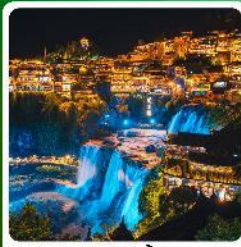
ฟูหลงเจิน