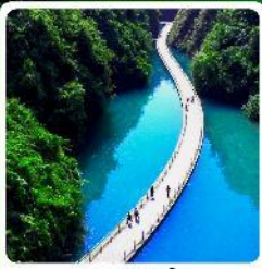
หุบเขาสิงโต