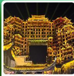
ตึกมหัศจรรย์ 72