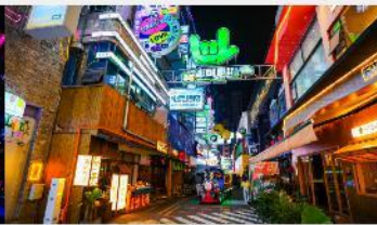
ถนนคนเดินซิงหยุน