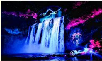
อุทยานน้ำตกหวงกั๋วซู่