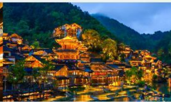
หมู่บ้านโบราณวูเจียงจ้าย