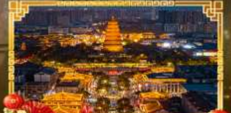
ถนนคนเดินราชวงศ์ถัง