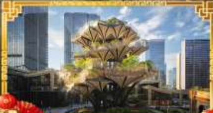
XIAN TREE&MIXC MALL

ซีอาน นครโบราณจีนชื่องดงาม | 4 วัน 3 คืน