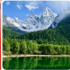
อุทยานบึงเพิงโกว