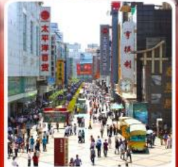
ช้อปปิ้งถนนคนเดินซุนซีลู่