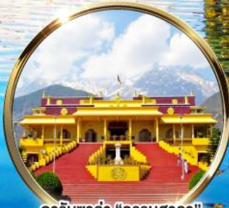
ดาริมซาล่า "ธรรมศาลา" ตำหนักองค์ดาโลลามะ