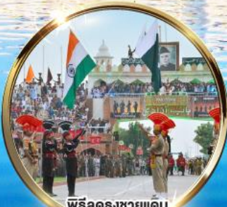
พิธีลดธงชัยแดน อินเดีย-ปากีสถาน ผ่านวาทะ