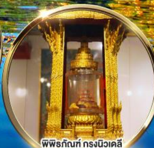
พิพิธภัณฑ์ กรุงนิวเดลี กราบมัสการพระบรมสารีริกธาตุ