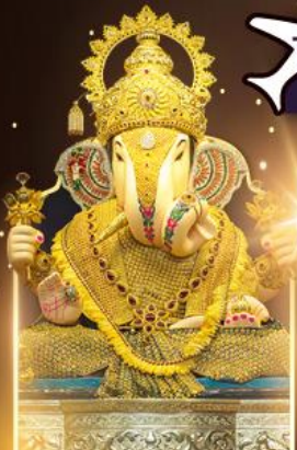
องค์ดีกษุท์เศษฐ์