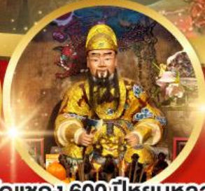
วัดแซก 600 ปี หุ่นหลวง