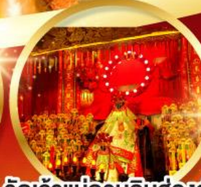
วัดเจ้าแม่กวนอิมฮ้องอำ