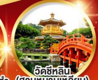
วัดซีหลิน (สวนหนานเท่หลิน)