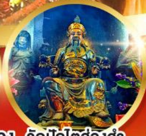
วัดปักไต้ฮ้องอำ