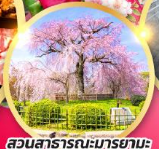
สวนสาธารณะมารุยามะ