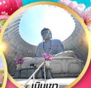
เป็นเขา แห่งพระพุทธรเจ้า