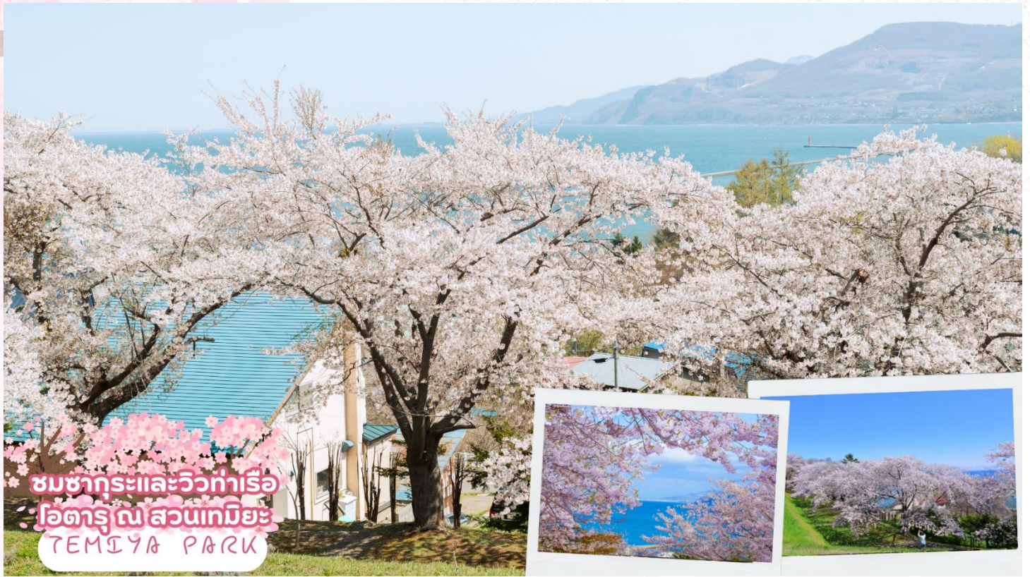
ชมซากุระและวิวท่าเรือ โอดารุ ณ สวนเทมิยะ TEMIYA PARK

ชมซากุระและวิวท่าเรือโอดารุ ณ สวนเทมิยะ (Temiya Park) เป็นหนึ่งในจุดชมดอกซากุระที่โด่งดังที่สุดในโอดารุในฤดูชมซากุระ อยู่บนภูเขา ช่วงฤดูดอกซากุระผู้คนจะหนาแน่น เนื่องจากที่นี่สามารถชมซากุระพร้อมกับชมทิวทัศน์ท่าเรือโอดารุ เหมาะสำหรับการพักผ่อนหย่อนใจและเพลิดเพลินกับวิวทะเลและดอกซากุระ โดยซากุระจะเริ่มบานในช่วงปลายเดือนเมษายนถึงต้นเดือนพฤษภาคม (ซากุระขึ้นอยู่กับสภาพอากาศของแต่ละปี)