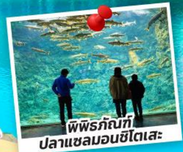
พิพิธภัณฑ์ ปลาชมมอนชิโตเสะ

ชมซากุระจุใจ ณ สวนอาซาฮิยามะ สวนสาธารณะมารุยามะ ชมหมู่บ้านเทพนิยายนิงเกิลเทอเรส