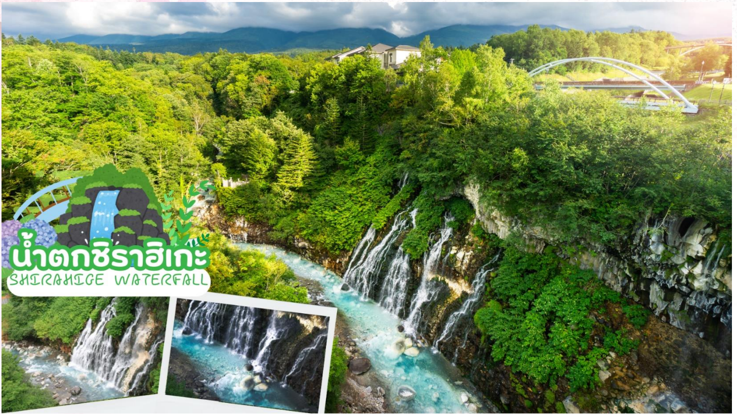
น้ำตกชิราฮิเกะ SHIRAHIGE WATERFALL

เดินทางสู่ เมืองอาซาฮิคาวะ เป็นเมืองที่ใหญ่เป็นอันดับสองของเกาะฮอกไกโด รองจากนครซัปโปโระ มีร้านค้าที่ขายข้าวและผักที่ปลูกได้ในเมือง และยังมีร้านอาหารทะเลตั้งอยู่มากมาย การคมนาคมสมบูรณ์แบบ ทำให้แต่ละปีมีผู้มาท่องเที่ยวกว่า 5 ล้านคนจากทั้งในและต่างประเทศ