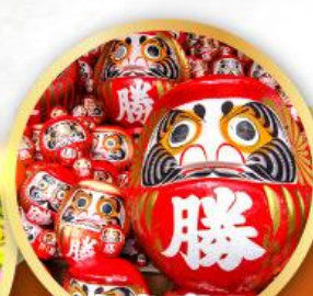
วัดคัตสึโงอิ (วัดดาร์มะ)

ชมความงามของกำแพงหิมะ เส้นทางสายอัลไพน์ ทากายามา (JAPAN ALPS SNOW WALL)