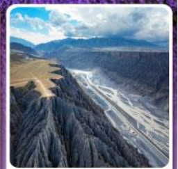
แกรนด์แคนยอนคู่ซานจื่อ