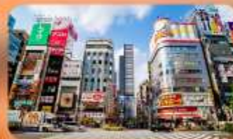
ซ้อปปิ้งชินจูกุ