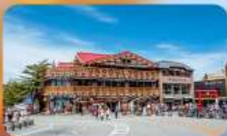
ภูเขาไฟฟูจิ ชั้นที่ 5