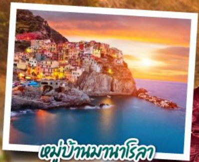
หมู่บ้านมานาโรคา