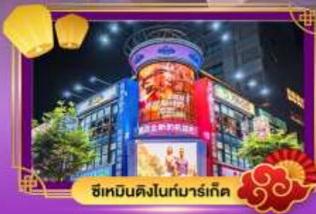
ซีเหมินดิงไนท์มาร์เก็ต