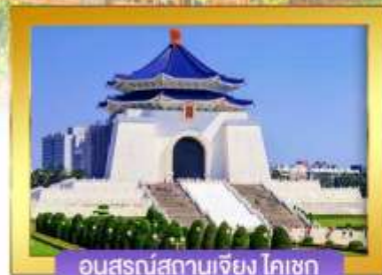
อนุสรณ์สถานเจียง ไคเชก