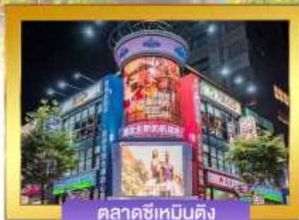
ตลาดซีเหมินติง