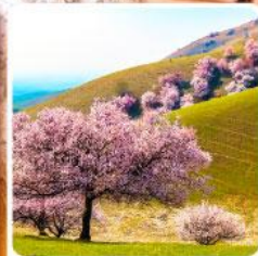
ทุ่งดอกอัลมอนต์