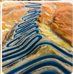
ถนนผานหลงกู่ต้าว