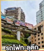
รถไฟทะลุคัง