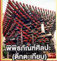
พิพิธภัณฑ์ศิลปะ (ตึกตะเกียบ)