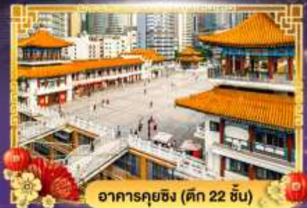
อาคารคุยซิง (ตึก 22 ชั้น)