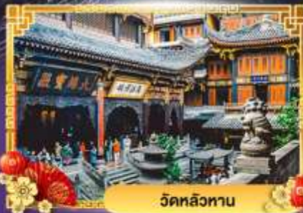
วัดหลิวทาน