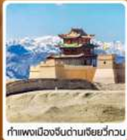
กำแพงเมืองจีนด่านเจี๋ยวี่กวน