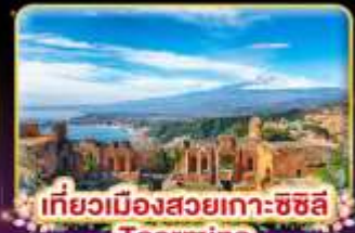
เที่ยวเมืองสวยเกาะซซิลี Taormina