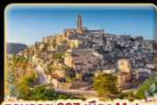
ตามรอย 007 เมือง Matera