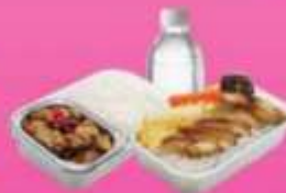
บริการอาหารร้อนบนเครื่อง ซาโป - ซากสึบ