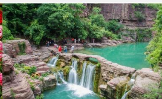
อุทยานหยุนโถซาน

*ทางบริษัทฯ ขอสงวนสิทธิ์ในการสลับโปรแกรมทัวร์ตามความเหมาะสมขึ้นอยู่กับสถานการณ์หน้างาน โดยคำนึงถึงผลประโยชน์ของลูกค้าเป็นสำคัญ