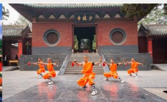
โชว์แสดงกังฟู