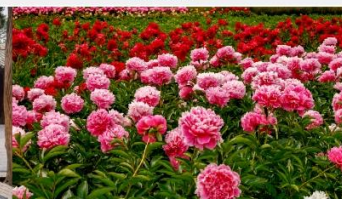
สวนดอกโบตั๋น