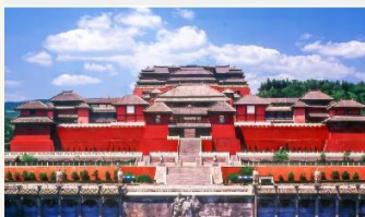
เมืองถ่ายภาพยนตร์