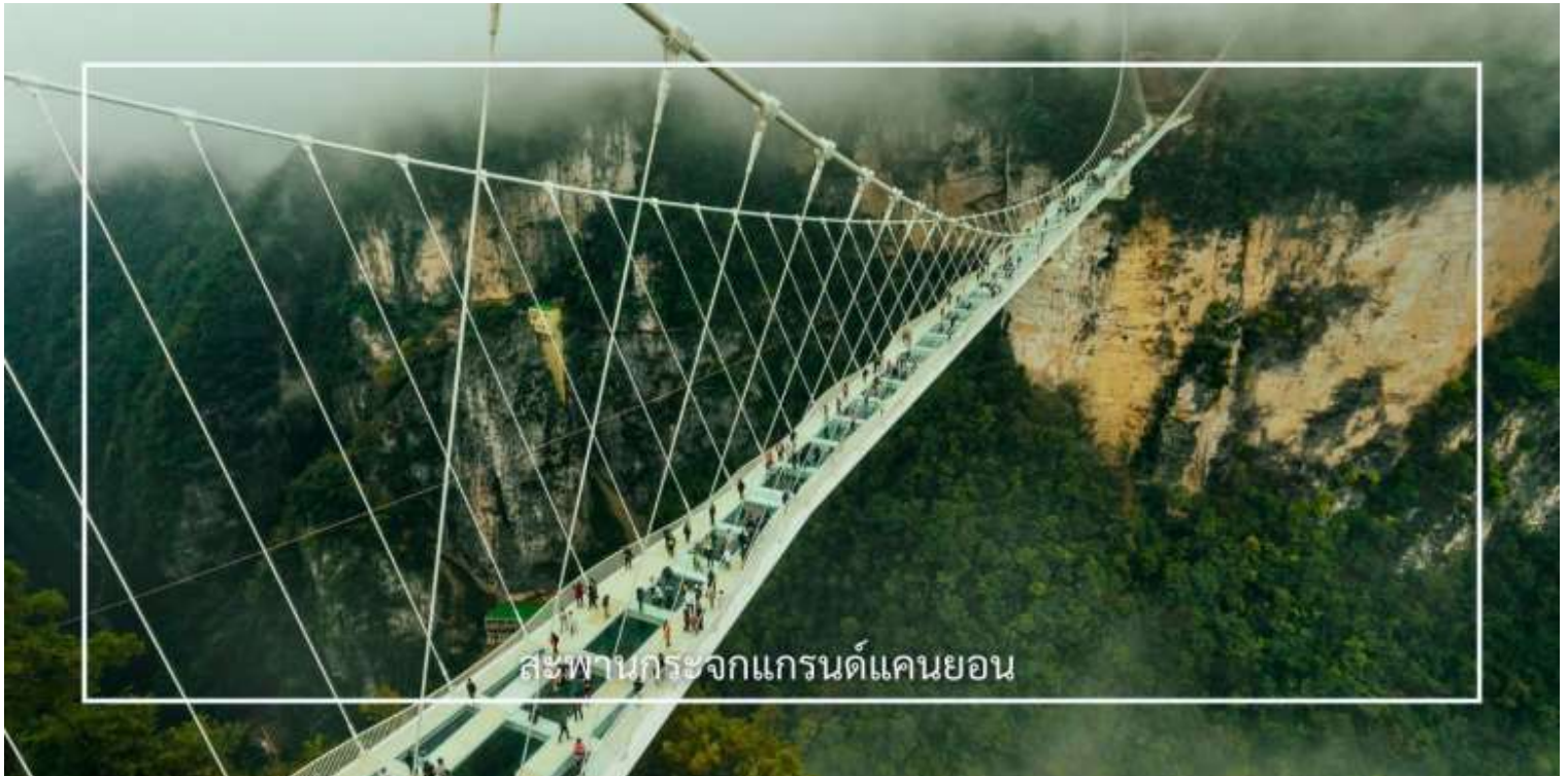
สะพานกระจกแกรนด์แคนยอน

ท่านสามารถเลือกซื้อบริการเสริม (Option) เพิ่มเติมได้: สะพานกระจกแกรนด์แคนยอน 400 หยวน/ท่าน สัมผัสประสบการณ์สุดตื่นเต้นกับการเดินบนสะพานกระจกใส ที่ทอดยาวเหนือหุบเขาสูง ให้ท่านได้ชมทัศนียภาพอันงดงาม แบบพาโนรามา พร้อมท้าทายความกล้าท่ามกลางบรรยากาศธรรมชาติอันยิ่งใหญ่