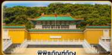
พิพิธภัณฑที่ถุกง