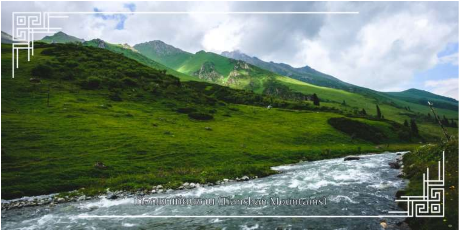
เทือกเขาเทียนชาน (Tianshan Mountains)