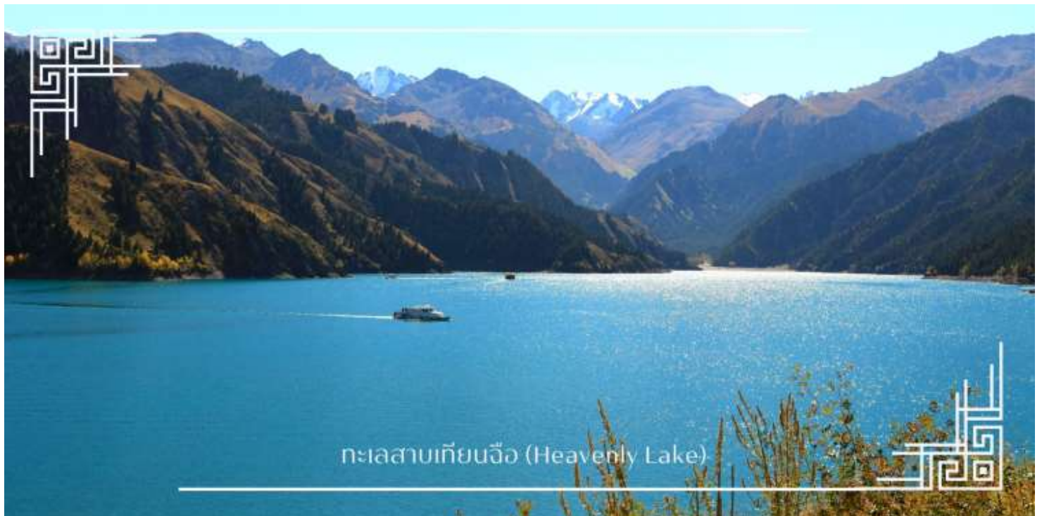
ทะเลสาบเทียนฉือ (Heavenly Lake)

นำท่าน ล่องเรือทะเลสาบเทียนฉือ (Heavenly Lake) ทะเลสาบน้ำจืดใสสะอาดราวกับกระจกเงา ท่ามกลางบรรยากาศเงียบสงบและอากาศอันบริสุทธิ์ ท่านจะได้ชมความยิ่งใหญ่ของยอดเขาที่สะท้อนเงาลงบนผืนน้ำสีมรกตอย่างใกล้ชิด มอบความรู้สึกที่ผ่อนคลายและประทับใจราวกับได้หลุดเข้าไปอยู่ในภาพวาดทิวทัศน์ระดับโลก (รวมค่าล่องเรือ)