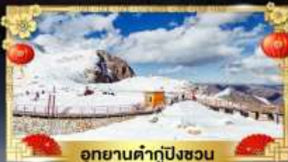
อุทยานคำกู่ปิงชวน