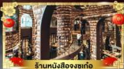
ร้านหนังสือจงซูเก๋อ