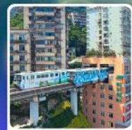
รถไฟฟ้า-ลัด