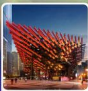
พิพิธภัณฑ์ศิลปะ-เทียน