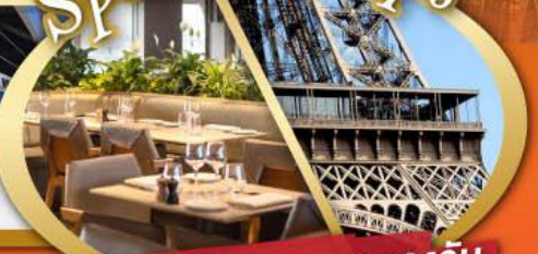
รับประทานอาหารกลางวัน บนหอไอเฟล

ไฮไลท์ในโปรแกรม • สะพานไม้ชาเปล ลูเซิร์น