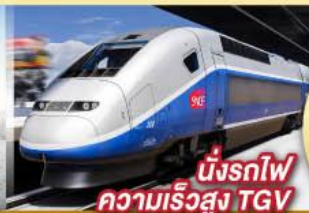
นั่งรถไฟ ความเร็วสูง TGV