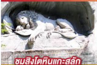
ชมสิงโตหินแกะสลัก