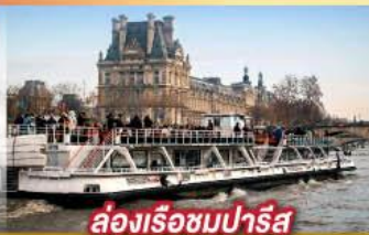
ล่องเรือชมปารีส