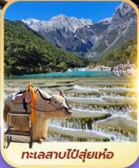
ทะเลสาบไป๋ส่วยเหอ