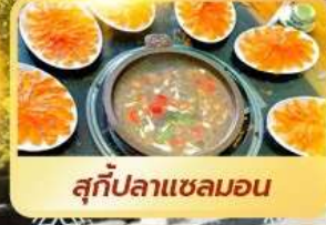
สุกี้ปลาแซลมอน