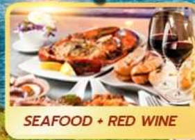
SEAFOOD + RED WINE