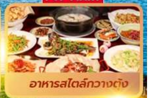
อาหารสไตล์กวางตุ้ง