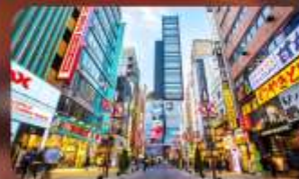
ซ้อปิ้งชินจูกุ