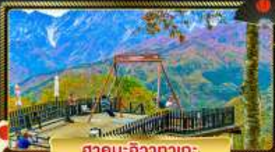
อาคิคุบะ:อิซากาตะ