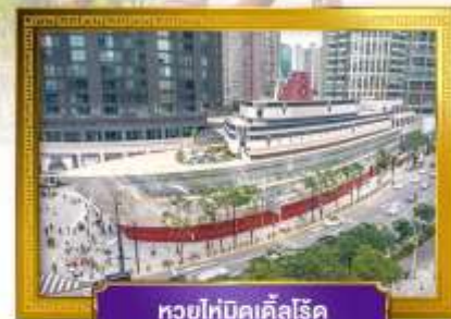
ทวยไห่บิคเคิลโรด