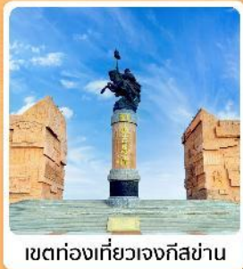
เขตท่องเที่ยวเจงกีสข่าน

ไฮไลท์ทะเลทรายอินเคินทาลา เขตท่องเที่ยวเจงกีสข่าน ทำเนียบพระลามะอูหลาน ตลาดตอนกลางคืนเมืองตาลาเต๋อ