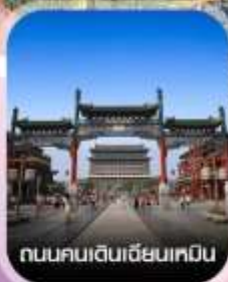
ถนนคนเดินเฉียนเหมิน

✈️ คอนเฟิร์มออกเดินทาง ทุกพีเรียด 2 ท่านขึ้นไป