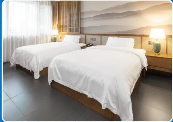
👤👤 TWIN (TWN)