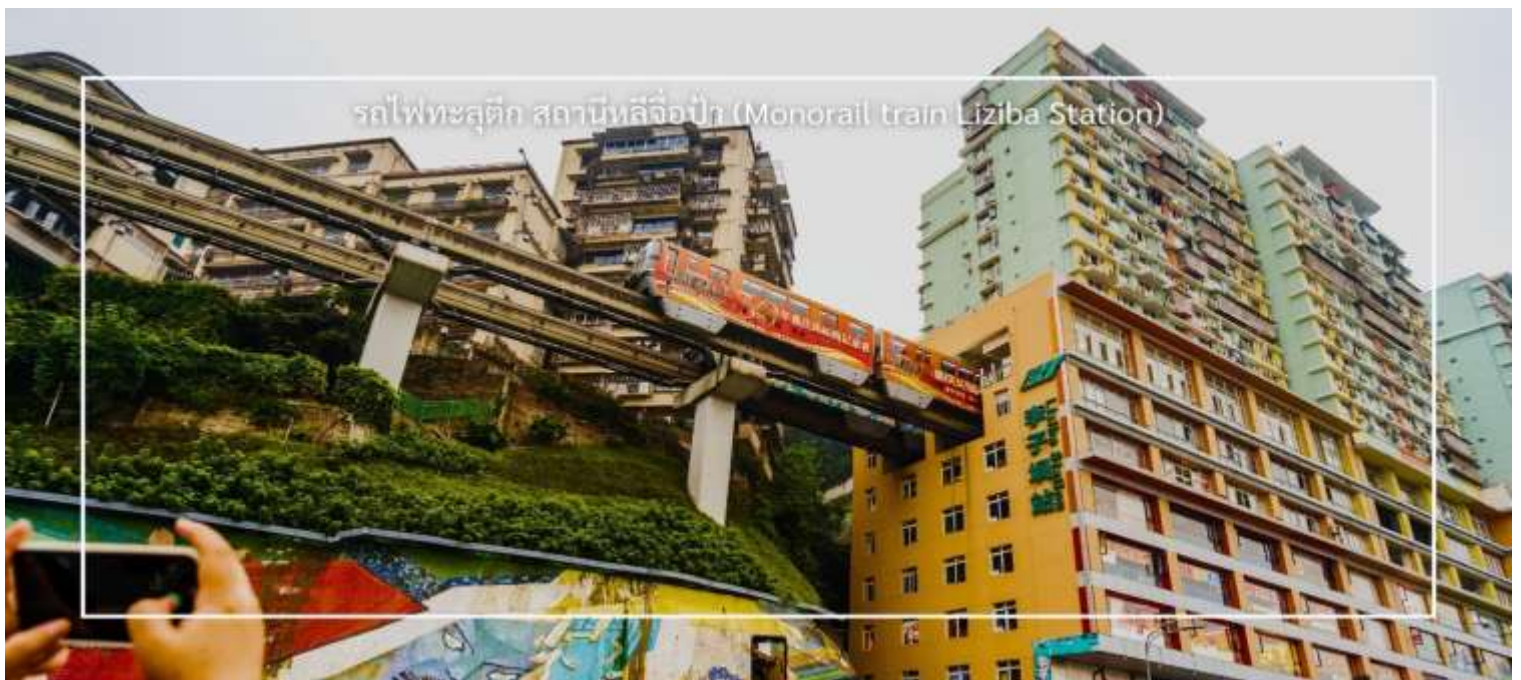
รถไฟทะลุตึก สถานีหลี่จื่อป้า (Monorail train Liziba Station)

นำท่านชม รถไฟทะลุตึก (Monorail Train) หนึ่งในแลนด์มาร์กที่สะท้อนความทันสมัยและเอกลักษณ์ของเมืองฉงชิ่ง รถไฟฟ้าโมโนเรลสาย 2 วิ่งทะลุผ่านตัวอาคารสูงอย่างน่าทึ่ง ซึ่งเป็นวิศวกรรมการสร้างสุดแปลกตา กลายเป็นปรากฏการณ์ที่โด่งดังระดับโลก ท่านสามารถชมและถ่ายภาพโมเมนต์สุดล้ำนี้จากมุมต่างๆ ของเมือง จุดชมวิวนี้ไม่เพียงสร้างความตื่นตาตื่นใจ แต่ยังเป็นสัญลักษณ์ของการผสมผสานระหว่างเมืองสมัยใหม่กับภูมิประเทศที่มีภูเขาและแม่น้ำรายล้อม