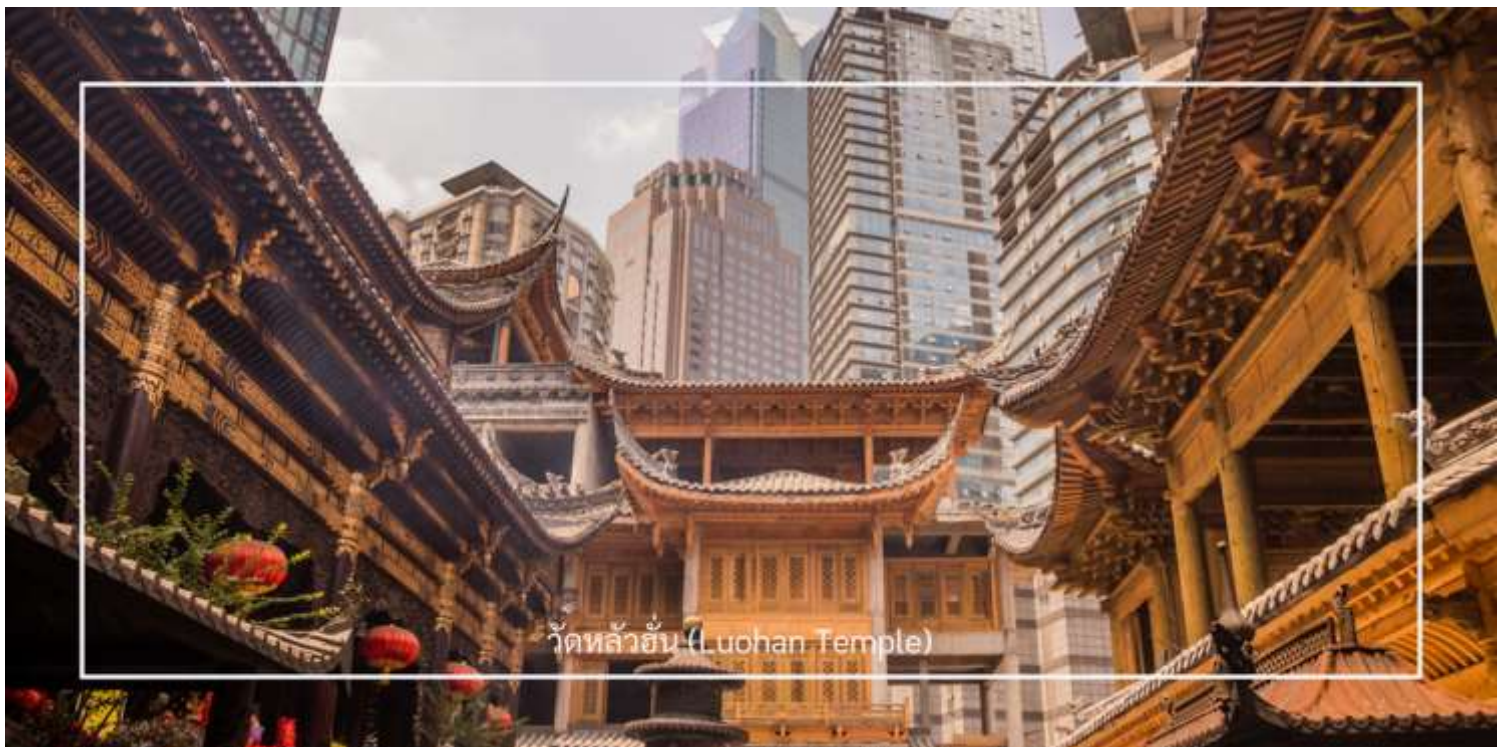
วัดหลัวฮั่น (Luohan Temple)

นำท่านเที่ยวชม วัดหลัวฮั่น (Luohan Temple) หรือที่เรียกว่า "วัดอรหันต์" เป็นวัดที่มีชื่อเสียงในเมืองฉงชิ่ง (Chongqing) มีประวัติศาสตร์ยาวนานและมีความสำคัญในด้านศาสนาพุทธ วัดหลัวฮั่นมีพระพุทธรูปและรูปปั้นอรหันต์จำนวนมาก ซึ่งเป็นที่เคารพนับถือของผู้มาเยือน นอกจากนี้ยังมีบริเวณที่ให้ผู้เข้าชมสามารถทำบุญและสวดมนต์