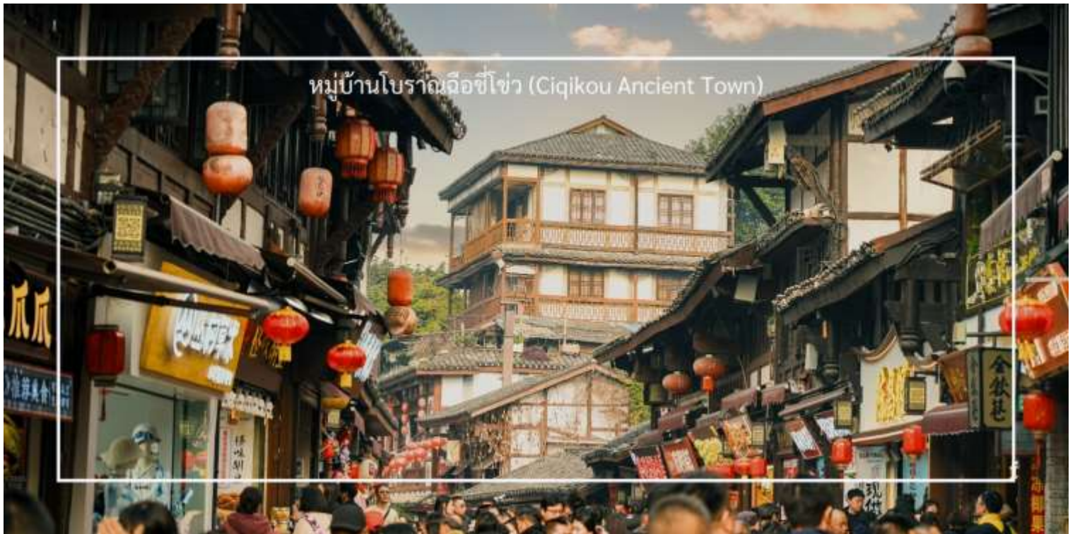
หมู่บ้านโบราณฉีโข่ว (Ciqikou Ancient Town)

ความคดเคี้ยวและเต็มไปด้วยร้านค้าขายสินค้าท้องถิ่น ร้านอาหาร และของที่ระลึก ซึ่งสามารถลิ้มลองอาหารท้องถิ่นและซื้อของที่ระลึกกลับบ้าน