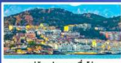
หมู่บ้านประมงซาโจ่ว