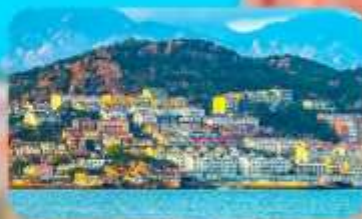
หมู่บ้านประมงซาจื่อโจว