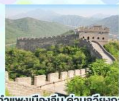
กำแพงเมืองจีน ด้านจวิยงกวน