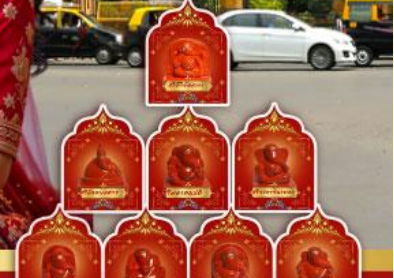
พระพิขเนศ 8 องค์ เมืองปูเน่