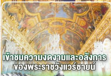
เข้าชมความงดงามและอลังการของพระราชวังแวร์ซายน์