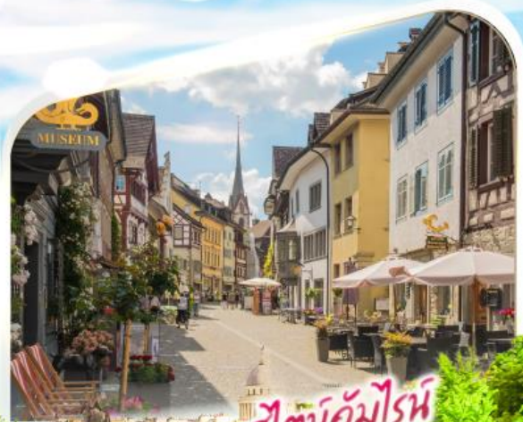
สีตน์อัมโมน