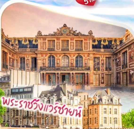
พระราชวังออร์แลนส์