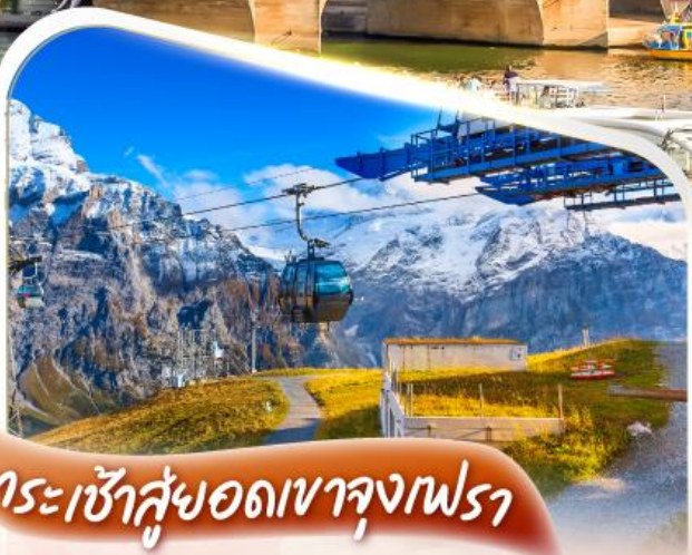
กระเช้าสูดยอดเขาจุงเฟรา